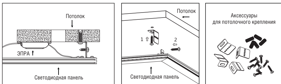
– Рисунок 5. Монтаж при помощи комплекта LP-KPP-D –