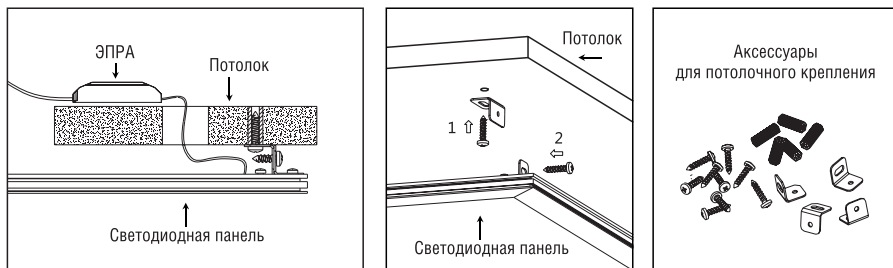
– Рисунок 4. Монтаж при помощи комплекта LP-KPP-K –