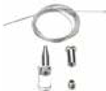
Комплект для подвеса арт. 01839 (на линию – 2N)